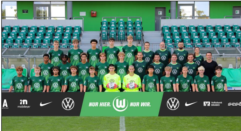
Budenzauber: B-Junioren VfL Wolfsburg beim i-unit-Cup 2026 in Braunschweig am Ball!

Mit Spannung blickt die U17 (ergänzt mit U16-Talenten) des VfL Wolfsburg auf den i-unit-Cup 2026 in Braunschweig. Zum diesjährigen Turnier in der Dennis Schröder Halle hat der veranstaltende BSC Acosta wieder ein gutes B-Junioren-Teilnehmerfeld zusammengestellt.