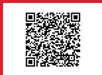
Mehr Infos gibts hier