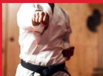
Karate für Kerle